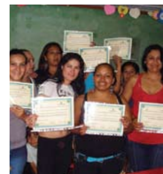
■ Proyecto: "Retazos"