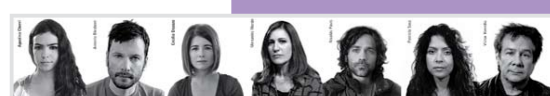
Los famosos Alzan la Voz