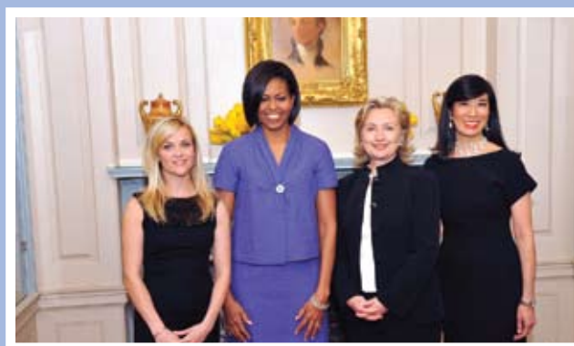
Reese Witherspoon, Michelle Obama, Hillary Clinton y Andrea Jung

Vital Voices Global Partnership y Avon Foundation for Women anunciaron la alianza global para poner fin a la violencia contra las mujeres. Una innovadora colaboración con el Departamento de Estado de los Estados Unidos para combatir los tipos de violencias más destructivos contra la mujer y ayudar a garantizar justicia para mujeres y niñas de todo el mundo. Estas organizaciones crearon la Alianza Global para poner fin a la Violencia contra las Mujeres, con el propósito de compartir experiencias y afianzar la colaboración para erradicar todas las formas de violencias de género: violencia doméstica, violencia sexual y trata de personas. La Alianza reúne delegaciones de quince países, compuestas por líderes de negocios, gobiernos y la sociedad civil, y cuenta con el apoyo de AVON y Avon Foundation, que han destinado un millón doscientos mil dólares para llevar adelante el proyecto.