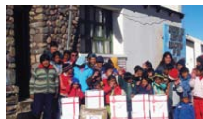
■ Proyecto: "Útiles de la Esperanza"

Esta actividad contó con el apoyo del Programa de Naciones Unidas para el Desarrollo (PNUD), ONU Mujeres y la Dirección General de la Mujer del Gobierno de la Ciudad de Buenos Aires.