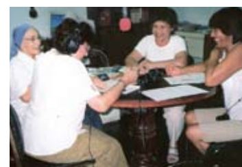
■ Proyecto: "Vuelo de Mariposas"